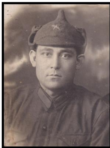
Репин Александр Семёнович