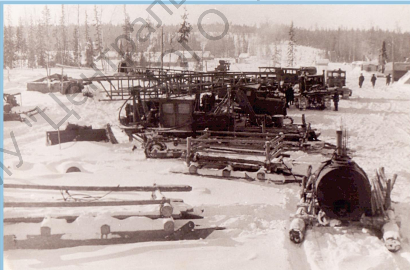
ГАРАЖ НА БАЗЕ СЕЙСМОПАРТИИ №16 НА р. БОЛЬШОЙ ПЭБУК