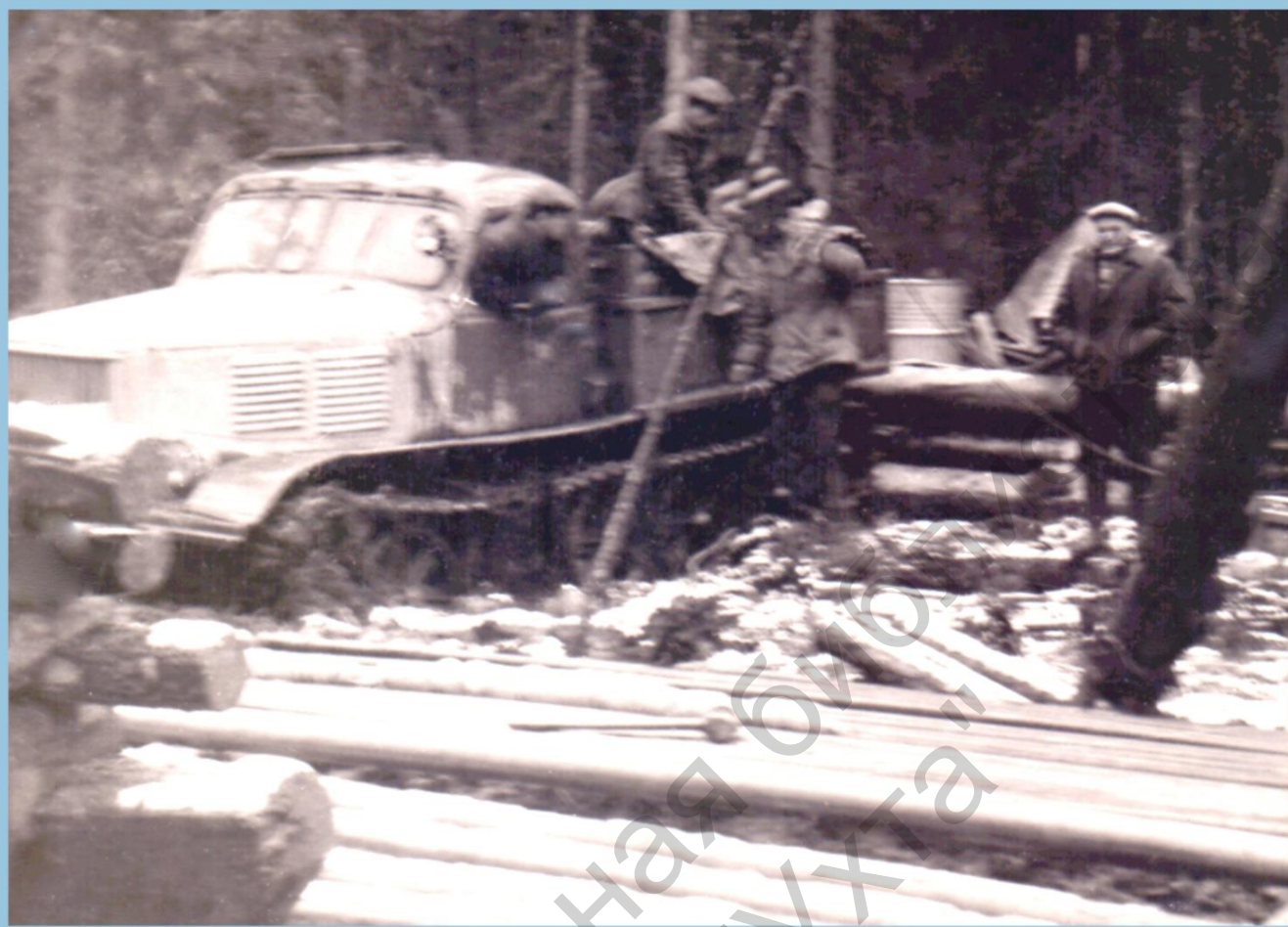
ПРИХОДЯТ НА ПОМОЩЬ ВЕЗДЕХОДЫ