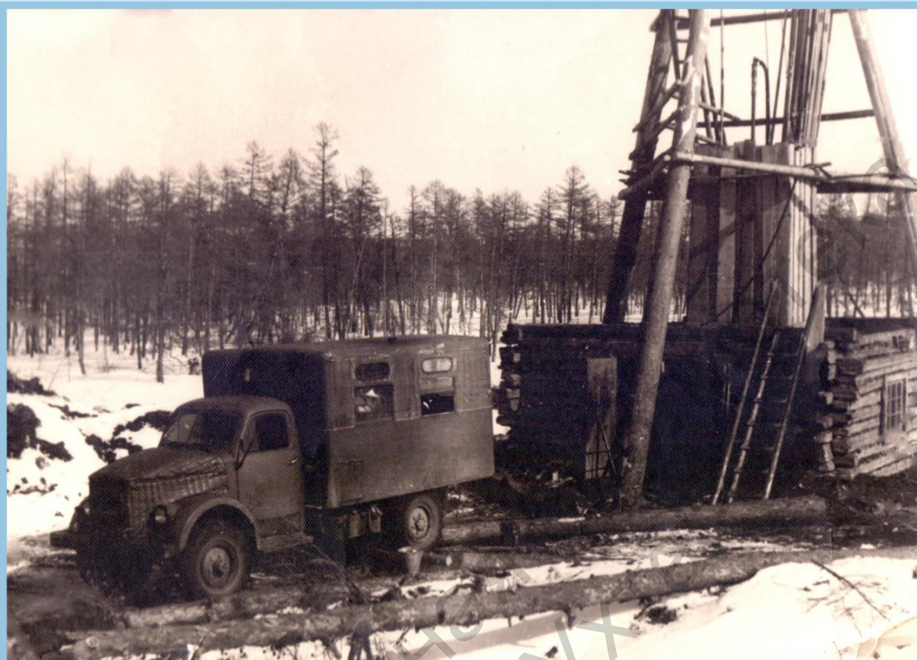
КАРОТЖАЖНАЯ СТАНЦИЯ НА БУРОВОЙ СКВАЖИНЕ