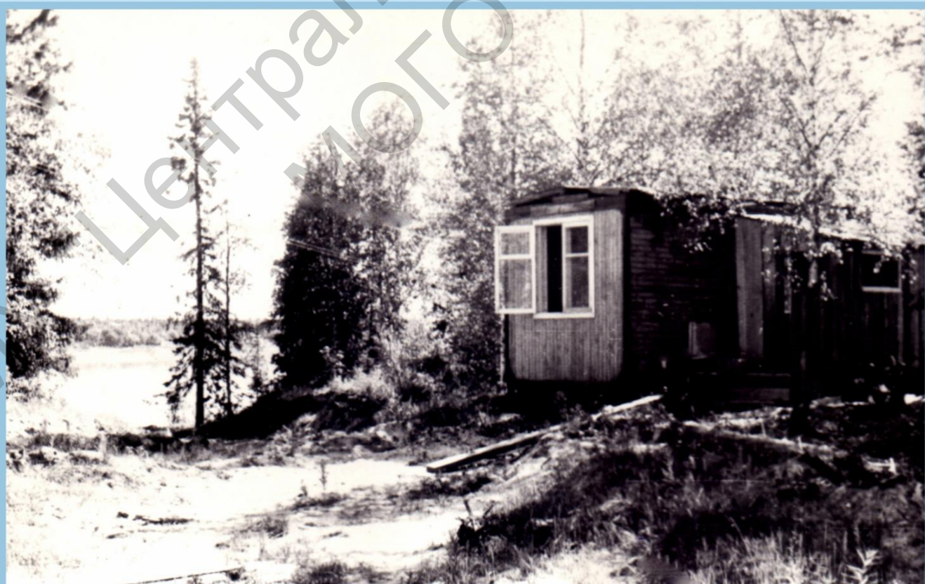
БАЛОК РАДИСТА СЕЙСМОПАРТИИ №10 СЕРГЕЯ КАНЕВА