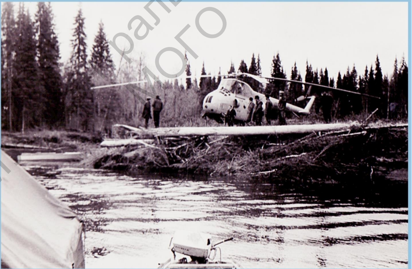
ТЕОФИЗИКИ ПРИЛЕПЕЛИ В ВЕРХОВЬЯ р. ВЫМЬ