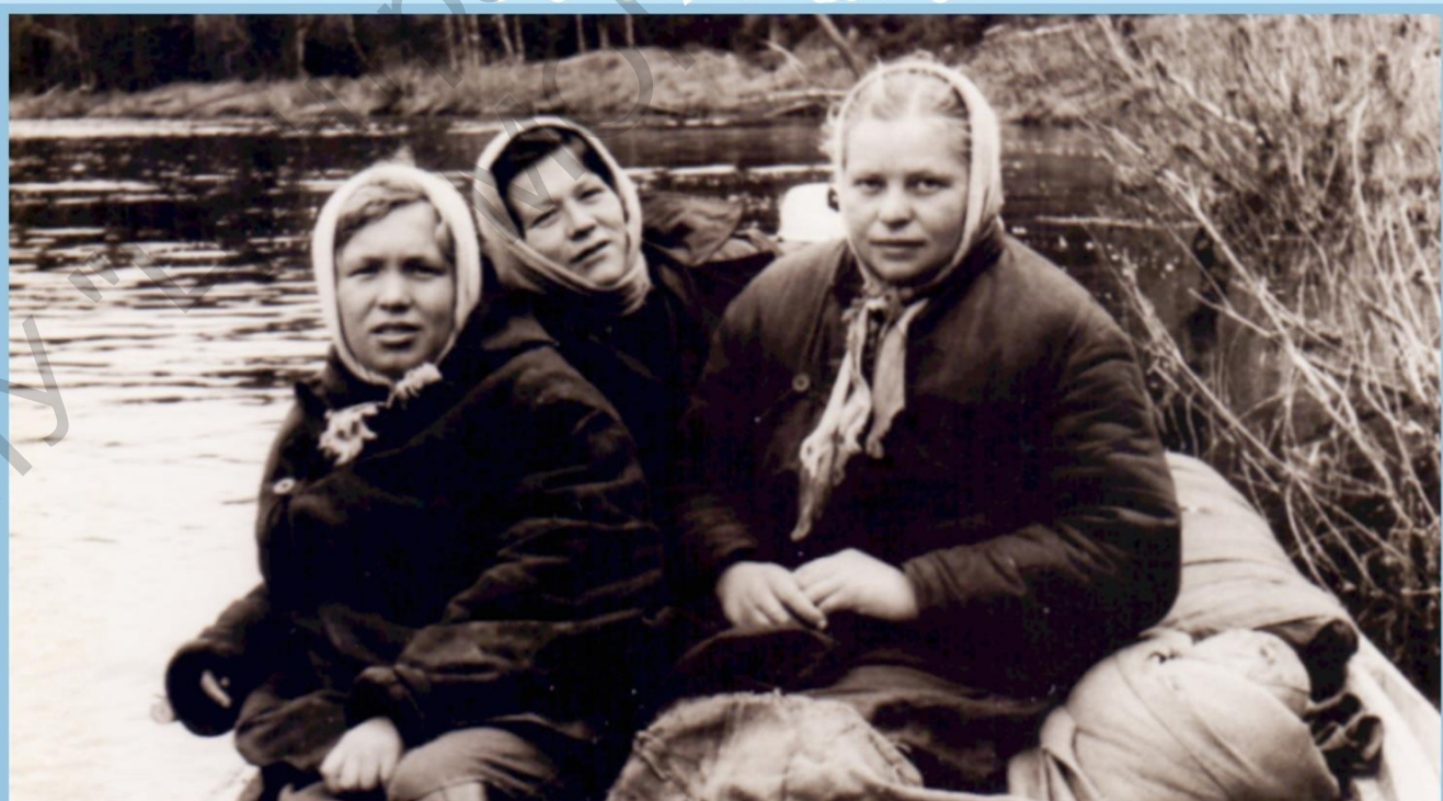
ЖЕНЩИНЫ – СЕЙСМОРАЗВЕДЧИКИ СПЛАВЛЯЮТСЯ