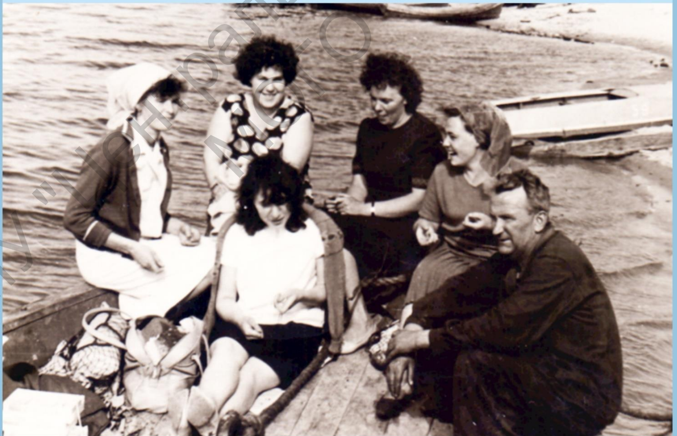
НА ПРИСПАНИ В г. НАРЪЯН-МАР. АВГУСТ 1967 г.