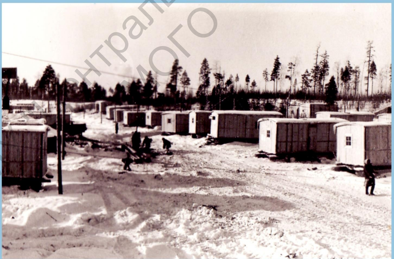
БАЗА СЕЙСМОПАРТИИ №12 В 1965 г.