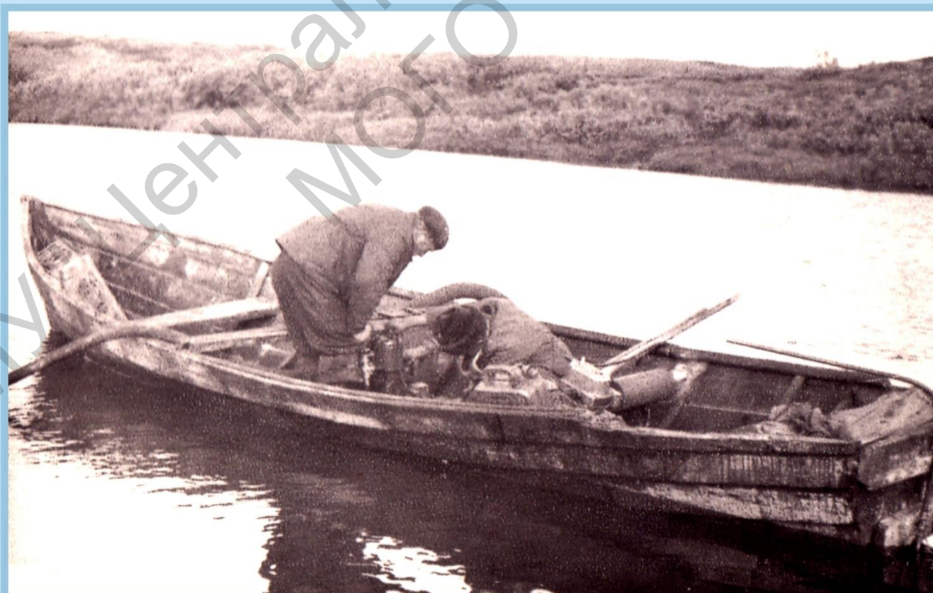
И БЕЗ ЛОДОК ТОЖЕ НЕ ОБОЙТИСЬ