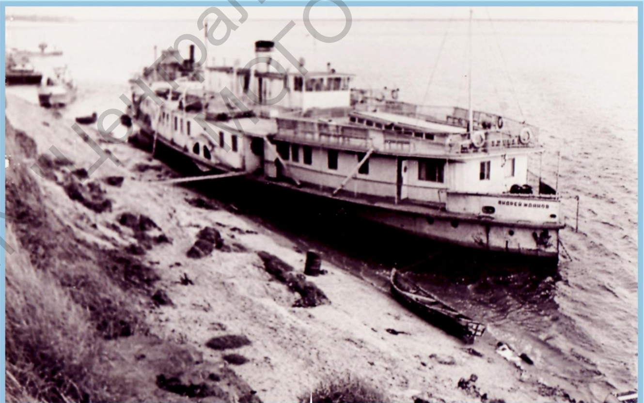
НЕ ОБОЙТИСЬ ТЕОФИЗИКАМ И БЕЗ РЕЧНОГО ТРАНСПОРТА