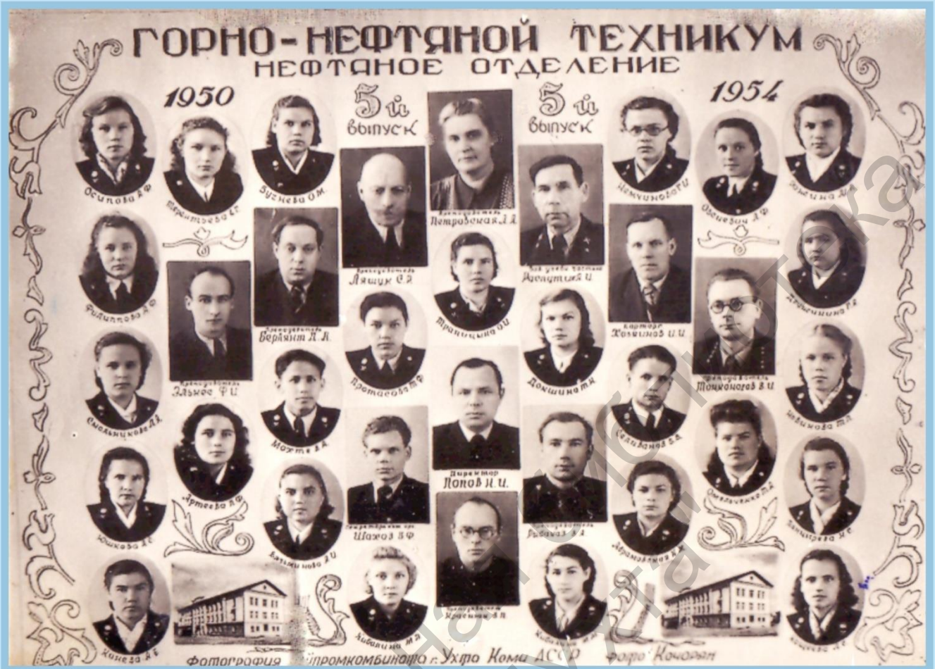
5-й ВЫПУСК НЕФТЯНОГО ОТДЕЛЕНИЯ ГОРНО-НЕФТЯНОГО ТЕХНИКУМА