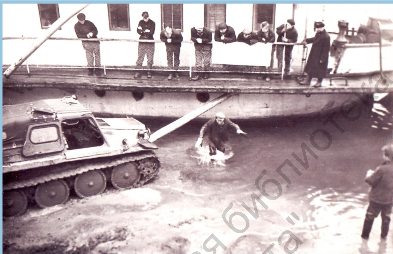
СЕЙСМОПАРТИЯ 20 ВЫРУЧАЕЛ ПАРХОД "А.ЖДАНОВ" НА р. ПЕЧОРА