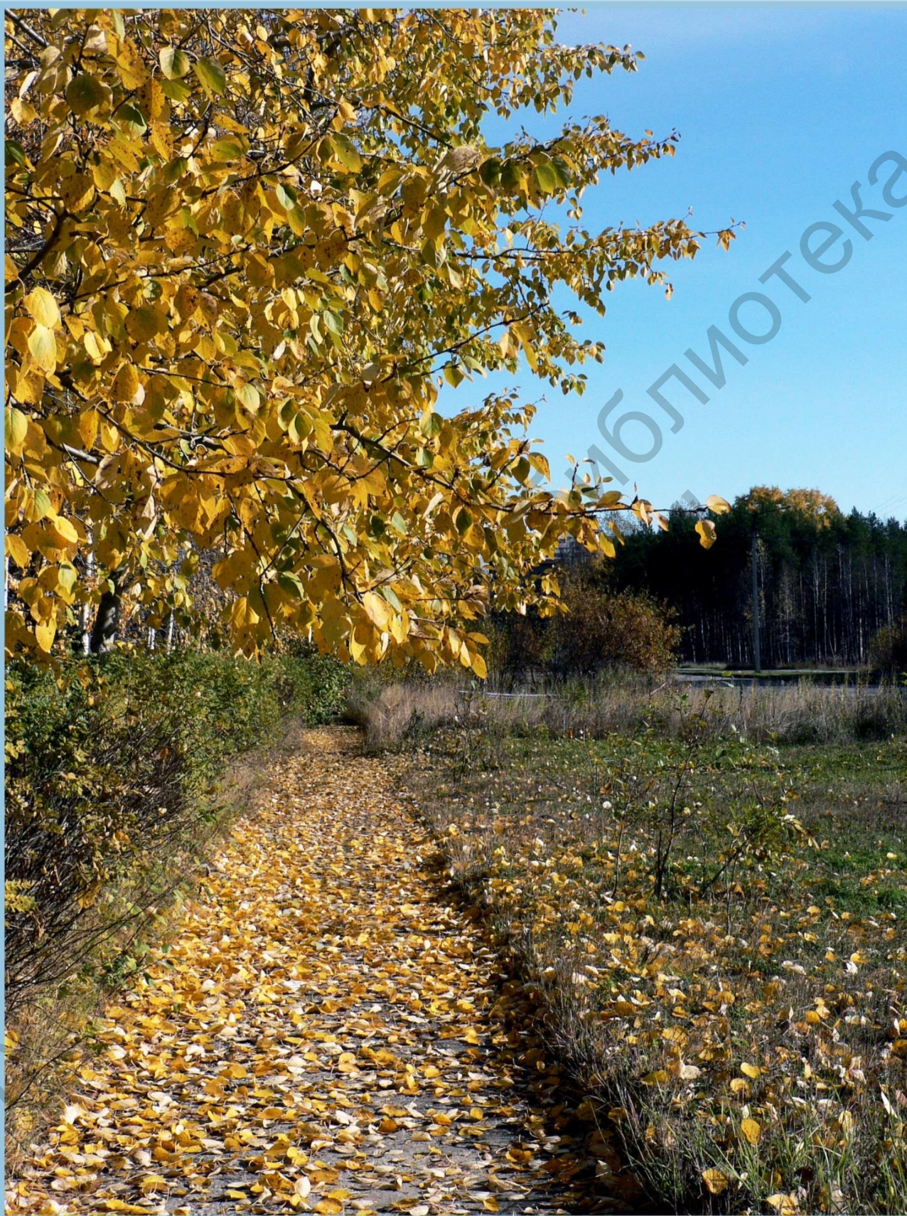
УЛИЦА ПЕРВОМАЙСКАЯ ОКОЛО УХТИНСКОГО ГОРНО-НЕФЛЯНОГО КОЛЛЕДЖА