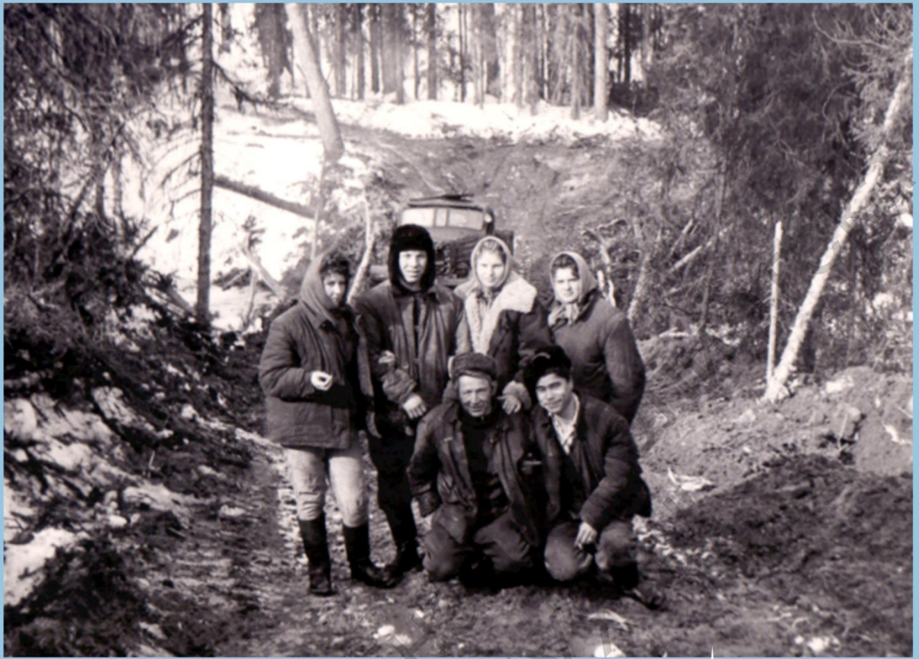
ИСПОЛЬЗУЮТ ТЕОФИЗИКИ ИНОГДА И АВТОМОБИЛИ