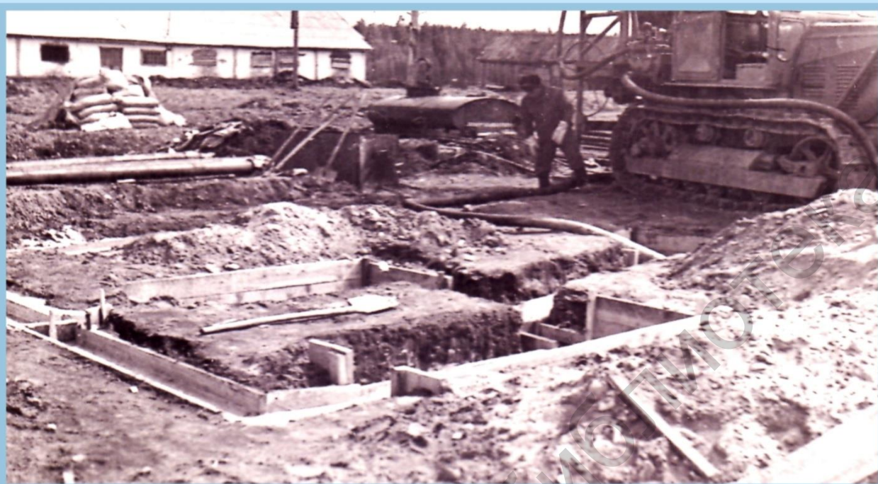
ПОДГОТОВКА ПЛОЩАДИ ДЛЯ БУРЕНИЯ СКВАЖИНЫ НА ВОДУ В дер. ТЭРДЬЕЛЬ В МАЕ 1965 г.