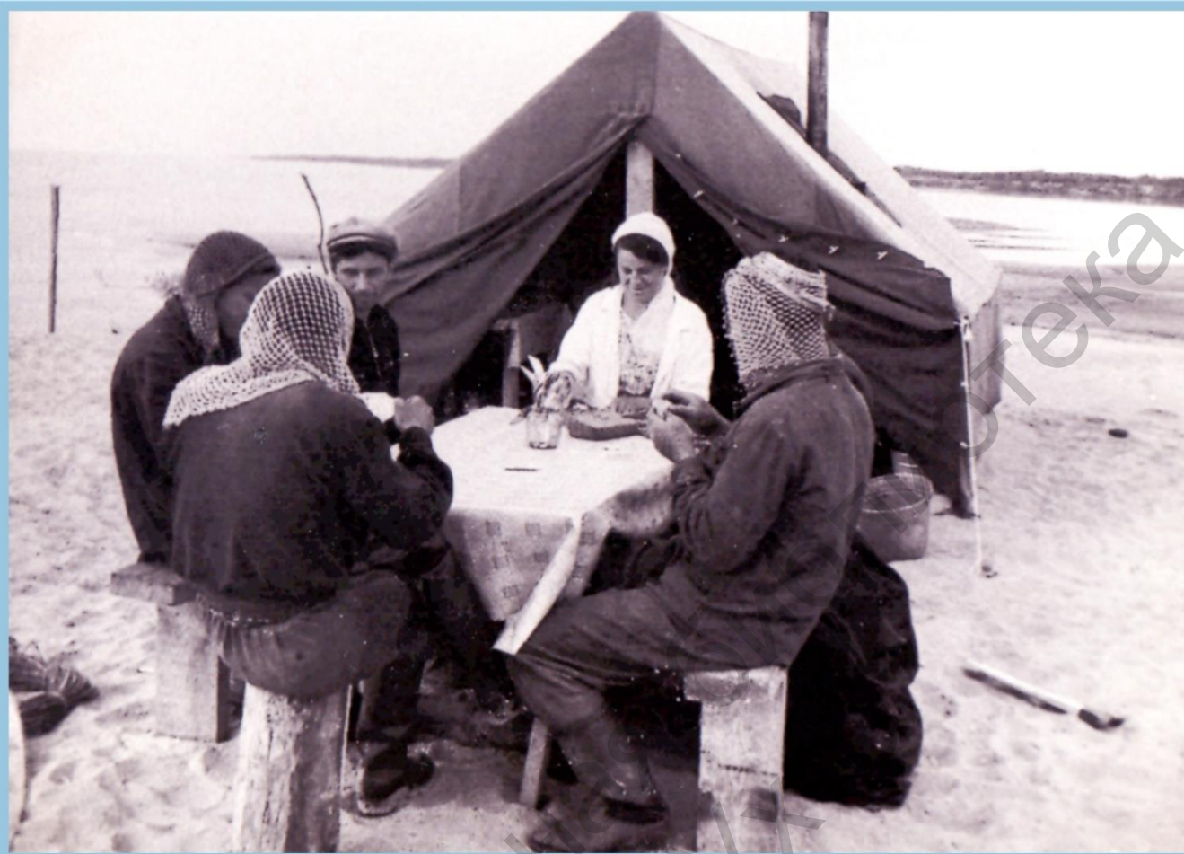
СЕЙСМОПАРТИЯ 20. ОПДЫХ С КАРПАМИ. 1964 г.