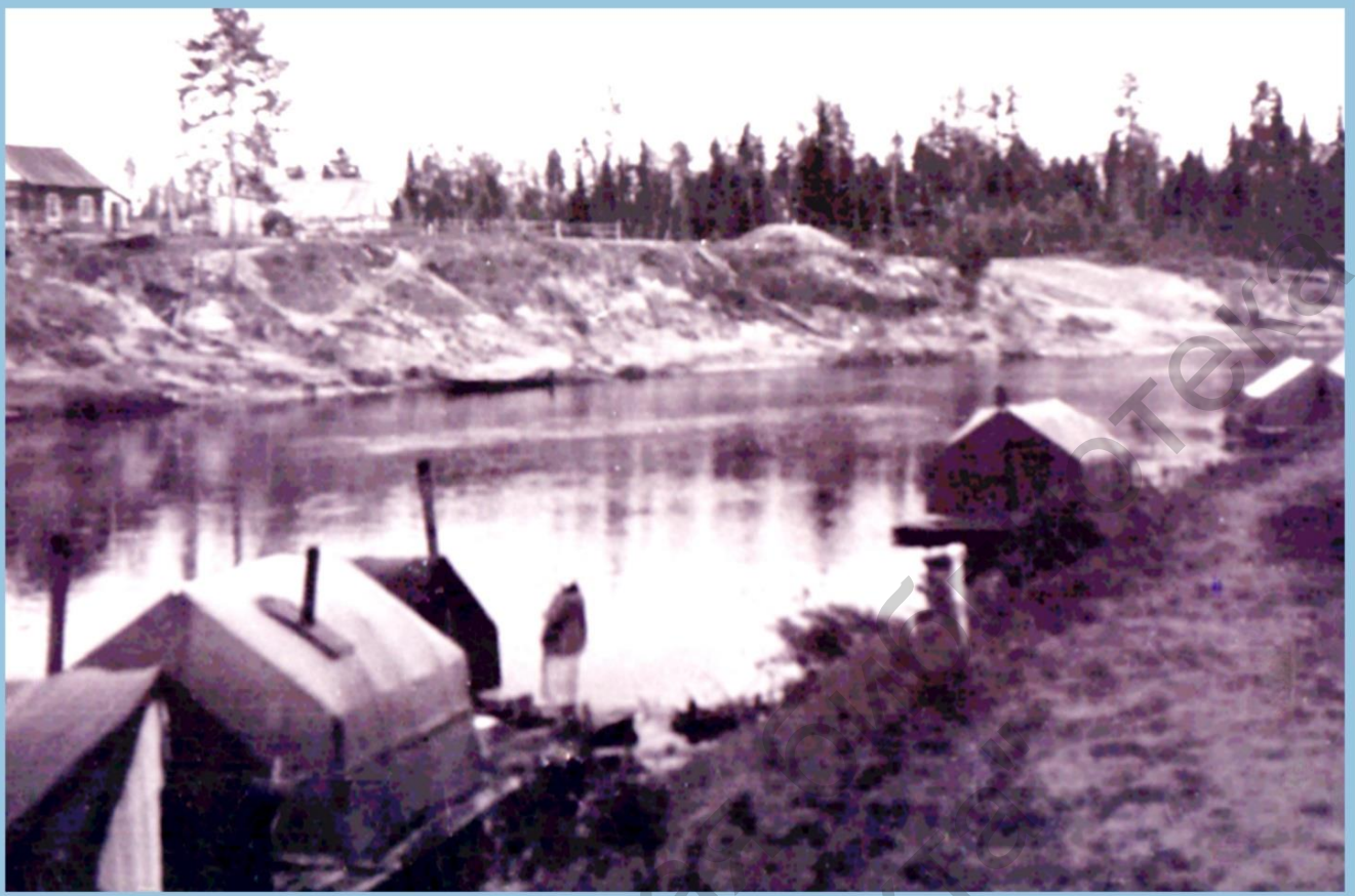
СЕЙСМОПАРТИЯ № 6 ОКОЛО пос. НАГОРНЫЙ НА р. ВЕЛБЮ.