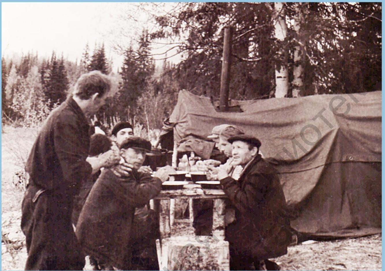
ОБЕД НА СВЕЖЕМ ВОЗДУХЕ ОЧЕНЬ ПОЛЕЗЕН