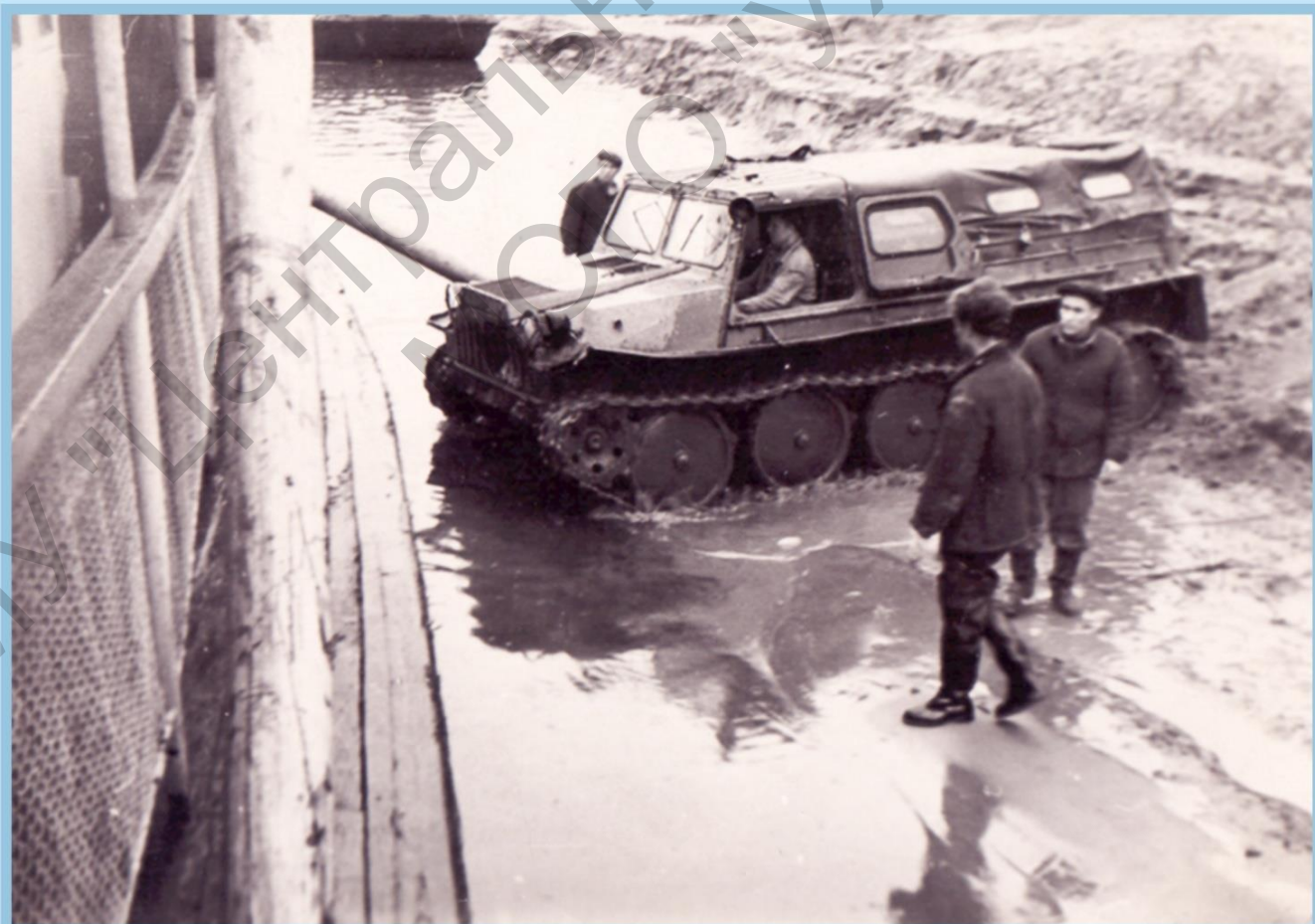
ВЕЗДЕХОДОМ СЕЙСМОПАРТИИ 20 СПОЛКНУЛИ ПАРХОД С МЕЛИ