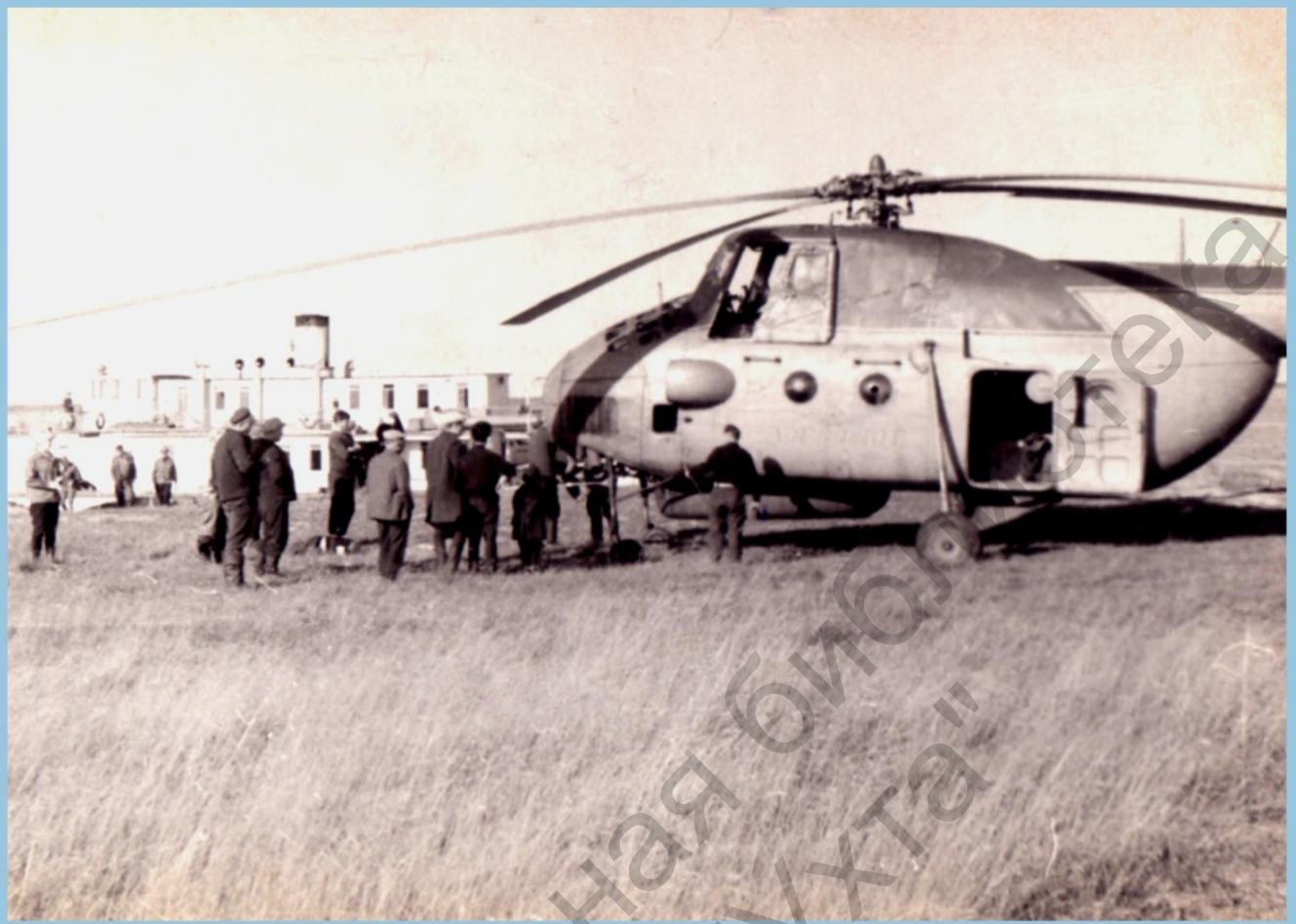
НАДЕЖНЫЙ ВОЗДУШНЫЙ ТРАНСПОРТ ТЕОФИЗИКОВ