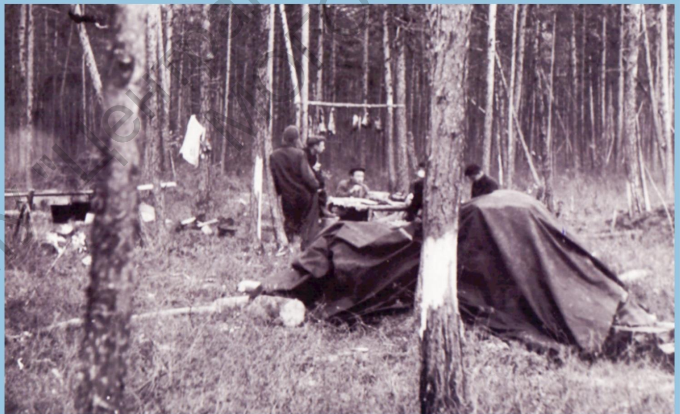
МОЖНО И ПЯК ПЕРЕКУСИТЬ