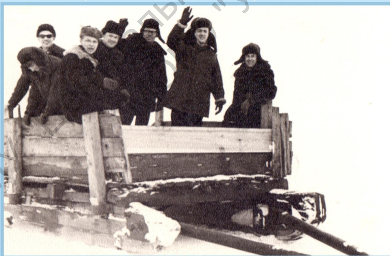
ВТЕРЁД – Қ НОВЫМ ОЛҚРЫЛҖЯМ!