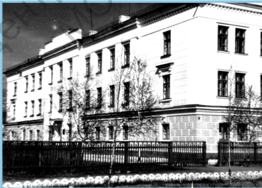
УХТИНСКИЙ ГОРНО-НЕФТЯНОЙ ТЕХНИКУМ В 1947–1978 гг.

6. Ухтинский государственный технический университет: Пути становления и развития / гл. ред. Н. Д. Цхадая. – Ухта: УГТУ; М.: изд. «ЦентрЛитНефтеГаз», 2008. – 311 с., ил.