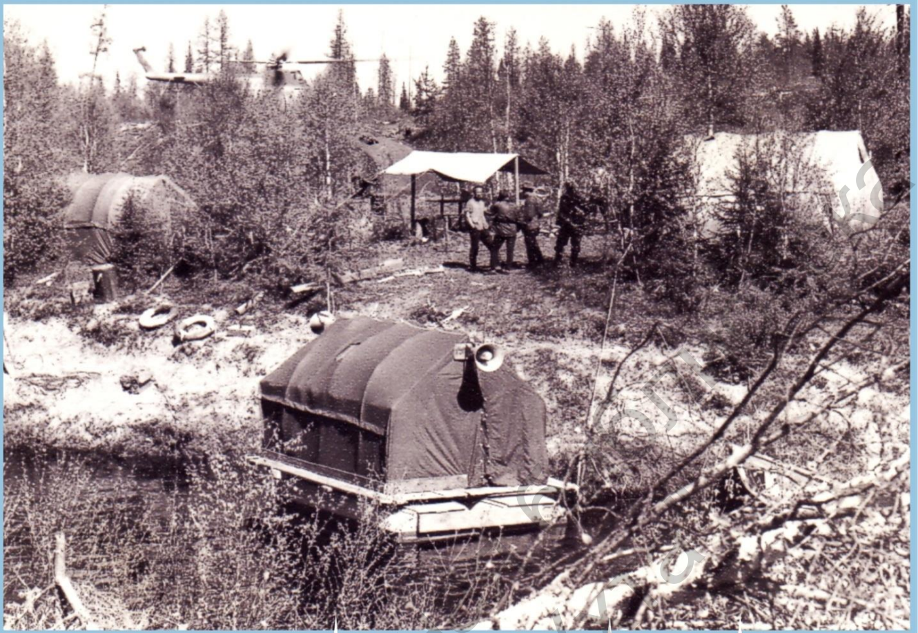
БАЗА НА р. ҚЫДРЫМ ГОТОВА Қ ПОЛЕВЫМ РАБОТАМ 1966 г.