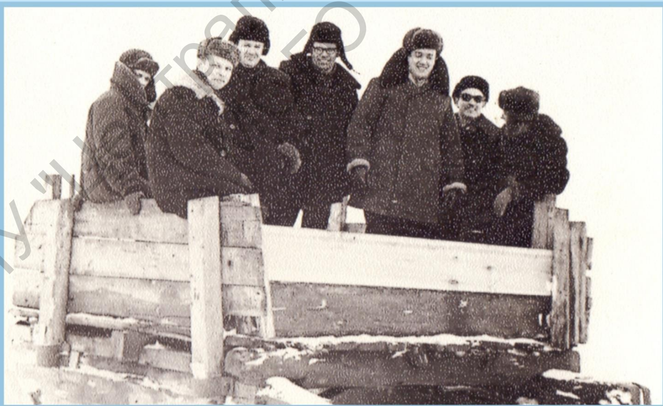
1970 г. "ТРАМВАЙ ПОДАНИ!", СЧАСТЛИВОГО ПУТИ И УСПЕХА!