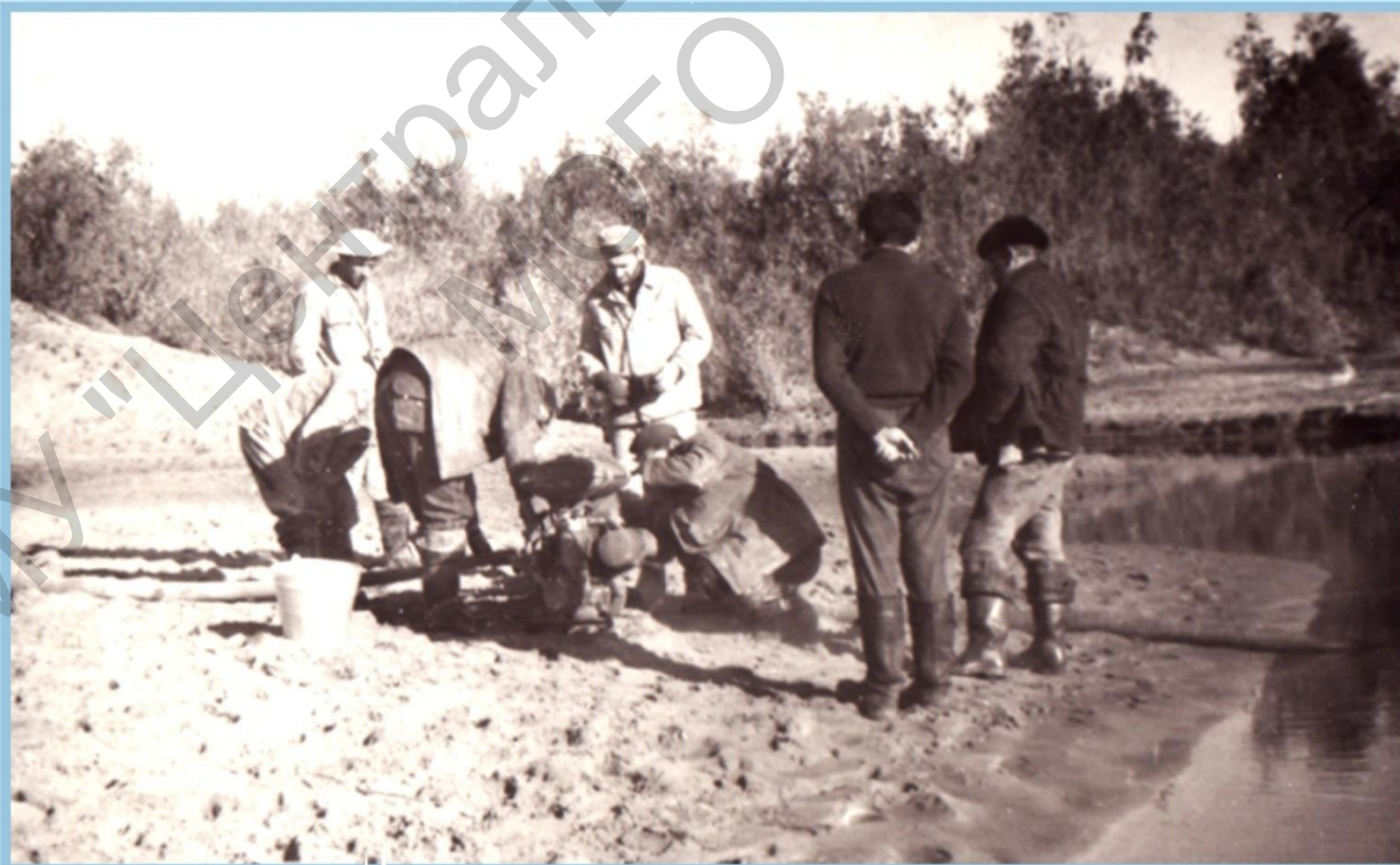
СЕЙСМОПАРТИЯ №140/66 НА р. КИЖИЕВКА. 1966 г.