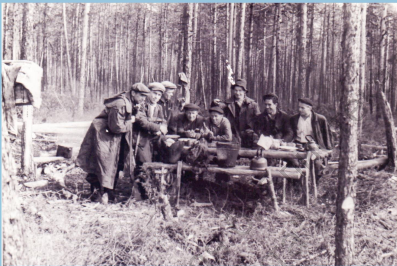
ДЖЪЕРСКЪЕ БОЛОТЦА. ПОДГОТОВКА КЪ ЛОХОДУ НА ОХОТЪУ