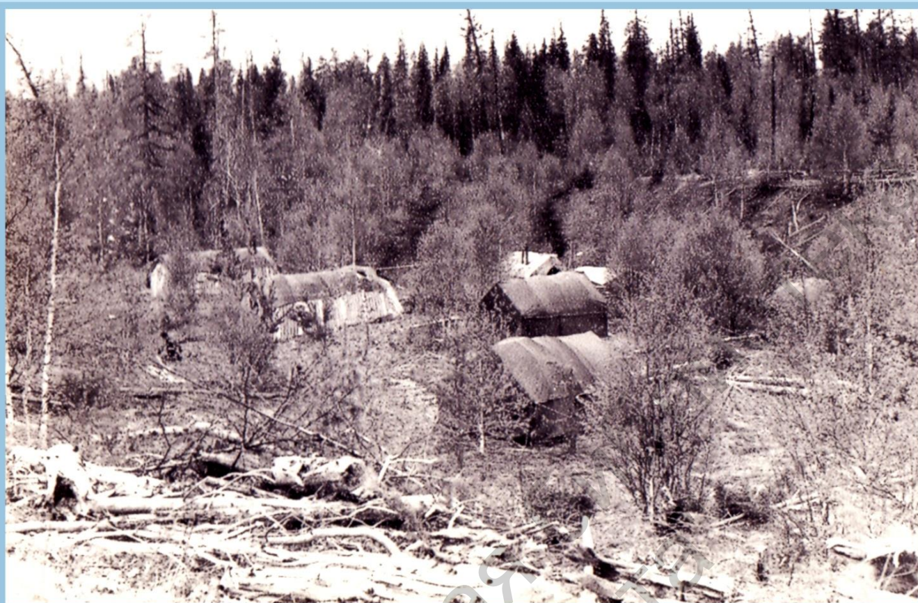
БАЗА СЕЙСМОПАРТИИ В ВЕРХОВЬЯХ р. КЫДРЫМ, 1966 г.