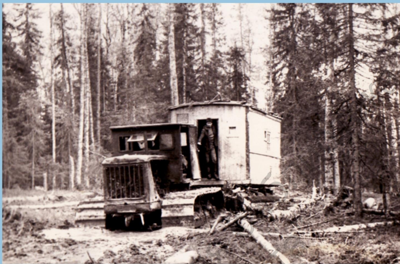
“НАМ НЕПРЕТРАД НИ В МОРЕ, НИ НА СУШЕ”