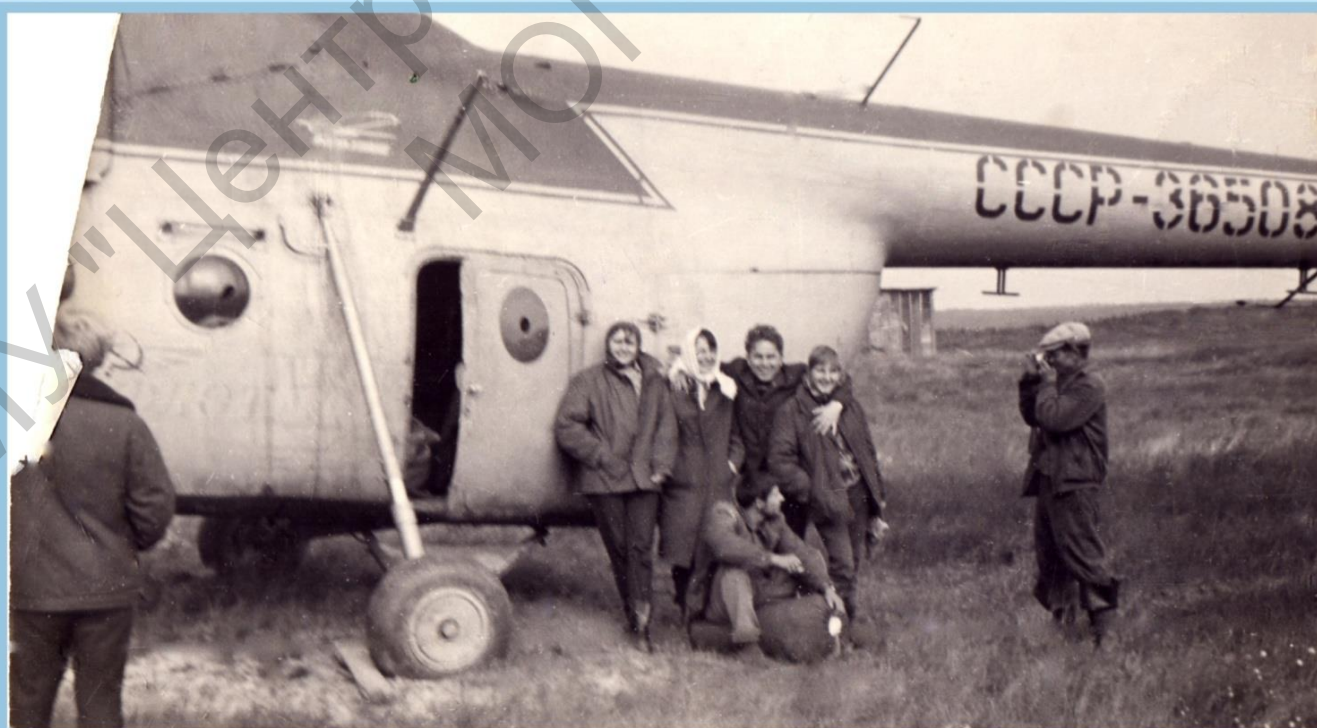
К ПЕРЕБАЗИРОВКЕ ГОПОВЫ