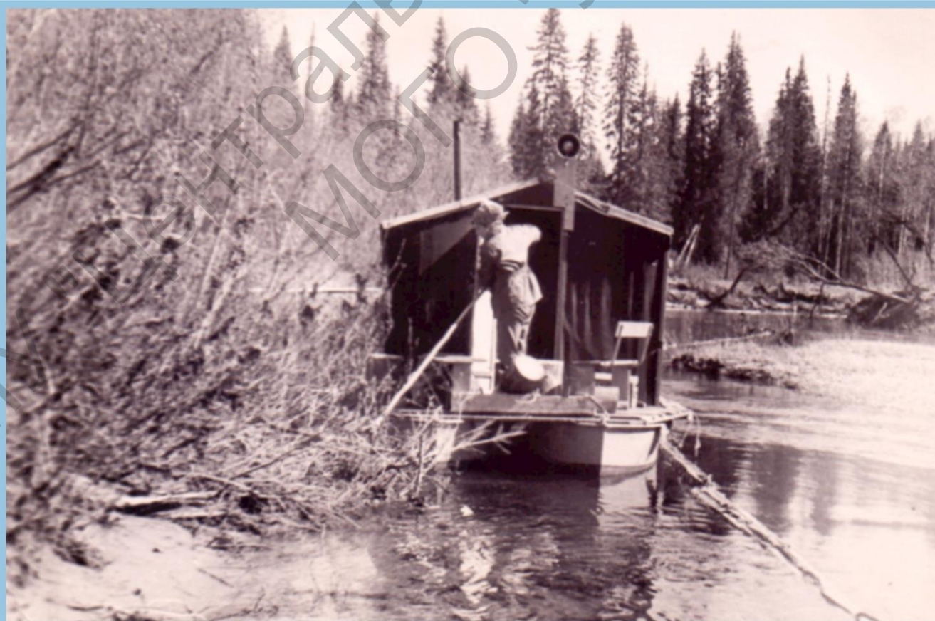
СПЛАВЛЕНИЕ К МЕСТУ РАБОТЫ ПО р. ВЫМЬ