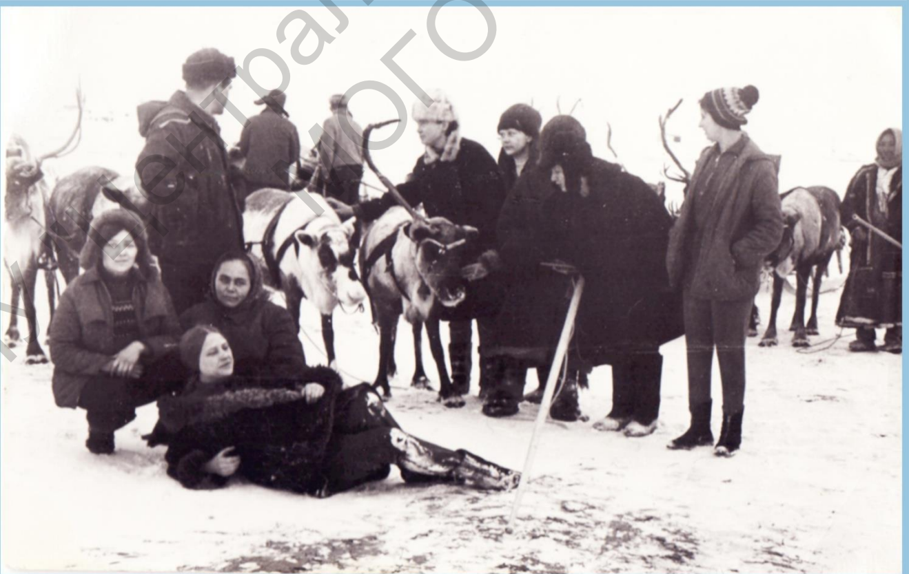
ПРИХОДЯТ НА ПОМОЩЬ И ОЛЕНЕВОДЫ