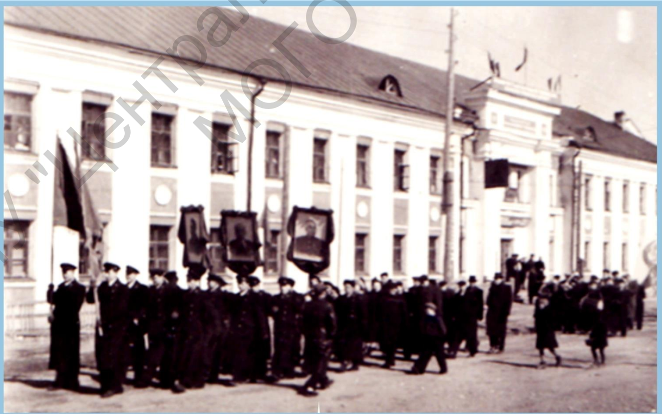
УЧЕНИКИ ТЕХНИКУМА НА ПАРАДЕ В 1951 г.