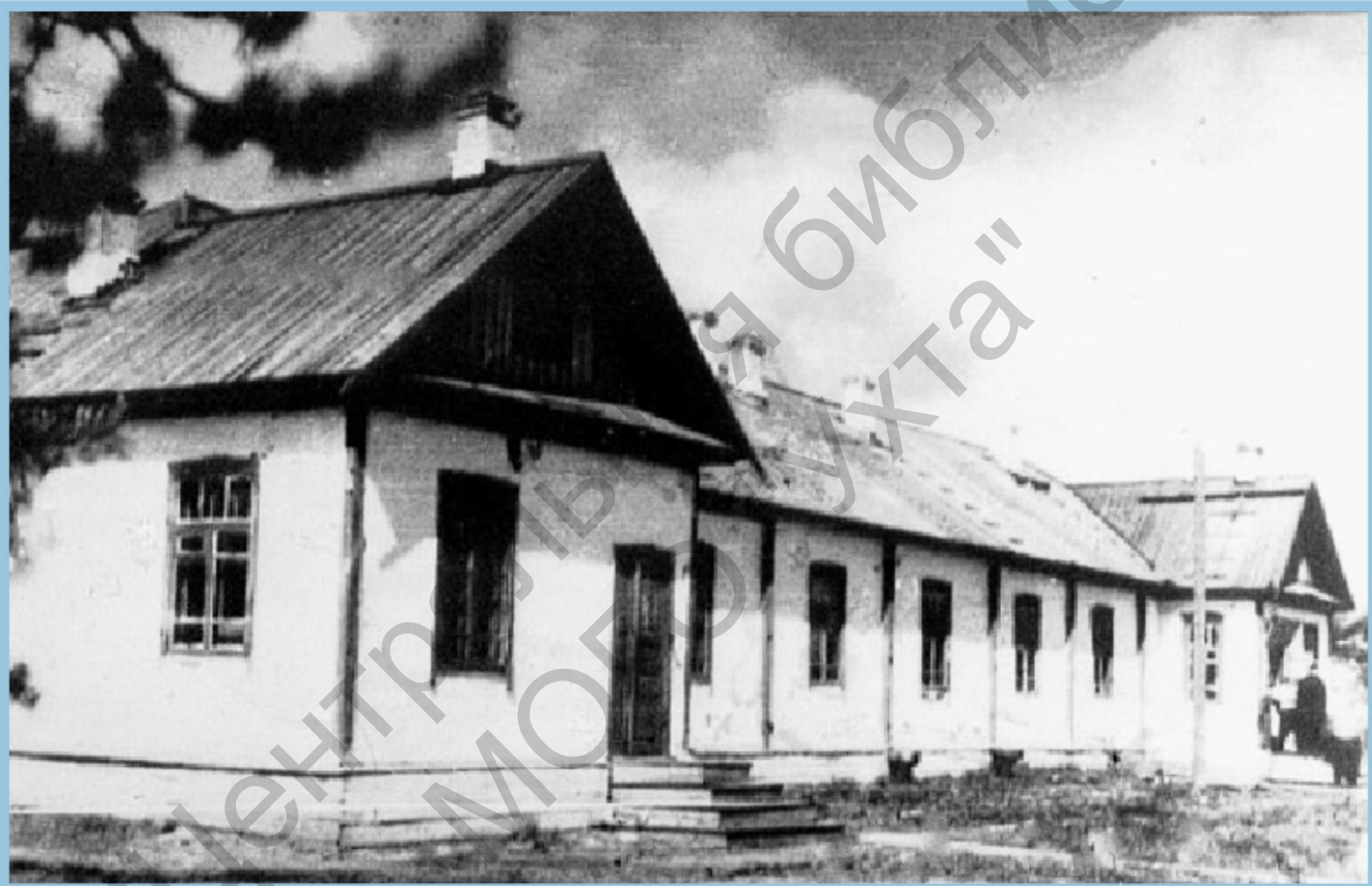
1945 г. УХЛИНСКИЙ ТОРНО-НЕФТЯНОЙ ТЕХНИКУМ. УЧЕБНЫЙ КОРПУС В пос. ВОДНЫЙ