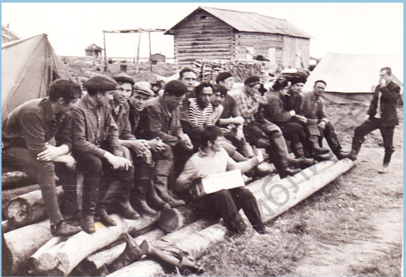
СЕЙСМОРАЗВЕДКА В дер. ЧЁРНАЯ НЕЖЕЦКОГО НАЦ. ОКРУГА ЗАВЕРШЕНА 30 ИЮЛЯ 1967 г.