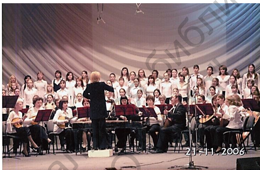
Выступление городского оркестра в дни празднования Дня города. 2006 г.