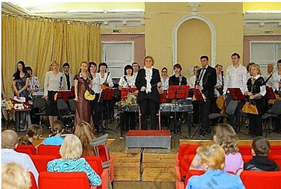
Выступление городского оркестра в МШ № 1. 2013 г.