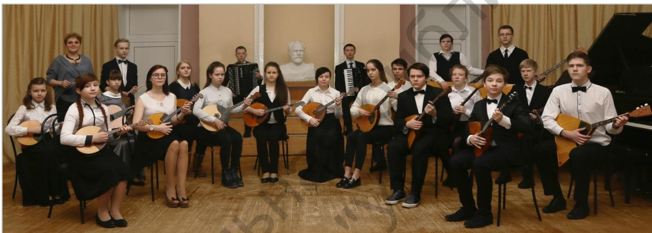
Оркестр русских народных инструментов – старшая группа ДМШ № 1

Кредо всех ухтинских оркестров в течение многих творческих лет - исполнять и пропагандировать огромный пласт классической оркестровой музыки XIX – XXI веков, знакомить слушателей с произведениями новых молодых авторов.