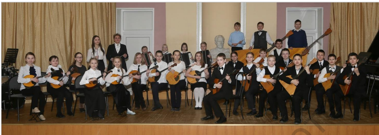
Оркестр русских народных инструментов – младшая группа ДМШ № 1