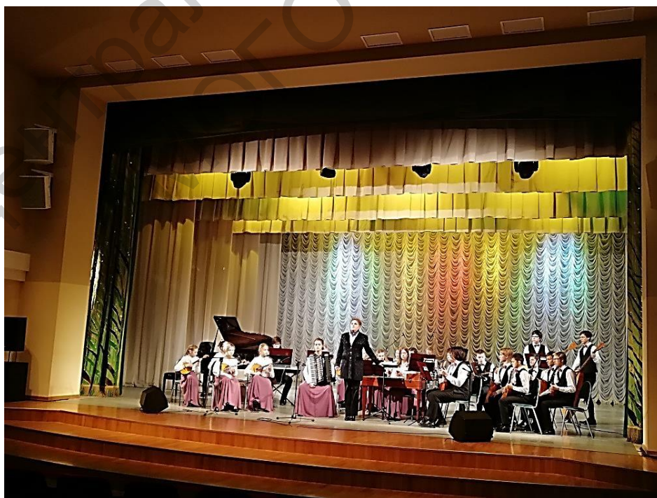
2018 г. Концертный зал гимназии искусств им. Спиридонова в г.Сыктывкаре. Конкурсное выступление оркестра русских народных инструментов – старшая группа ДМШ № 1 г. Ухты