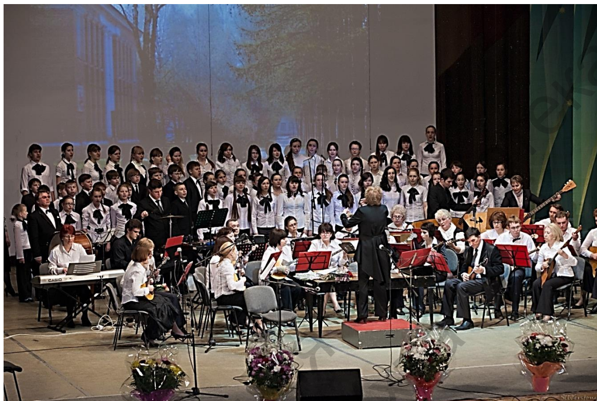
2017 г. Детской музыкальной школе 65 лет.

2017 год - сольный концерт ко Дню славянской письменности и культуры в г.Ухте.