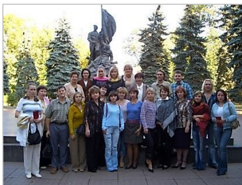
Во время поездки на конкурс. Оркестр в Парке Победы, г. Москва