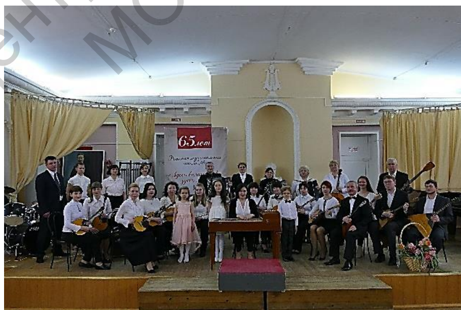
Сольный концерт городского оркестра в музыкальной школе № 1. Фото на память с участниками оркестра младшей группы МШ №1. 2007 г.