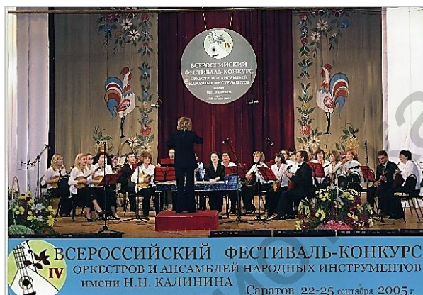
Выступление оркестра на конкурсе