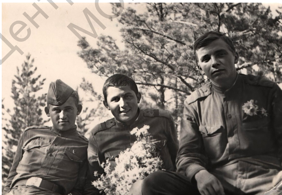
С армейскими друзьями