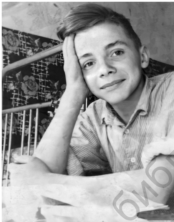
Студент 1 курса Исовского геологоразведочного техникума в мечтах о будущем, 1964 г.