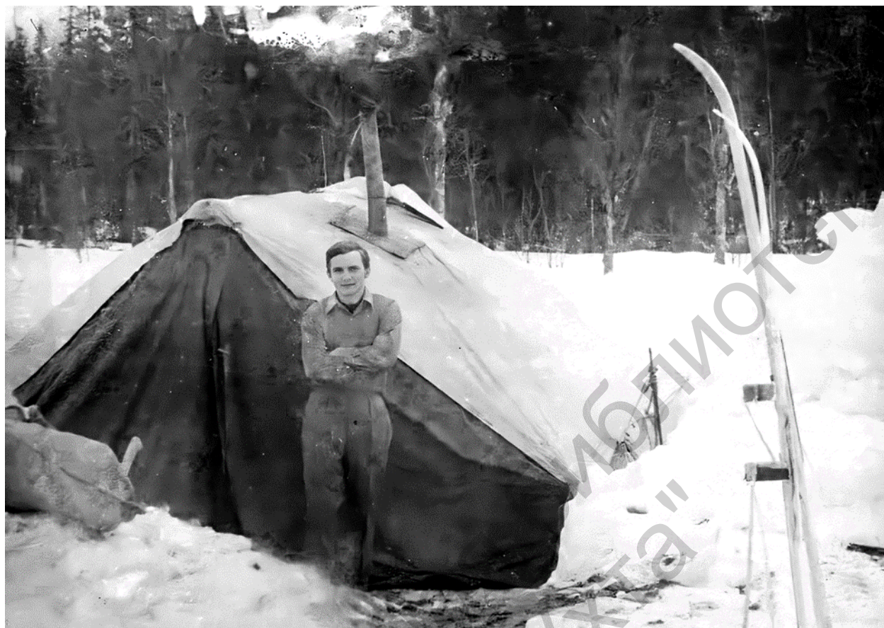
Полевые работы, 70-е годы