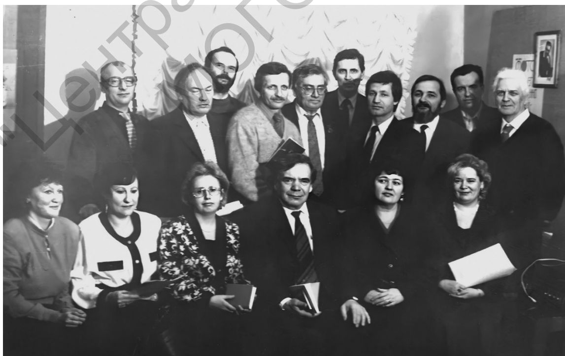
40-летие Лито, г. Ухта, 1995 г.