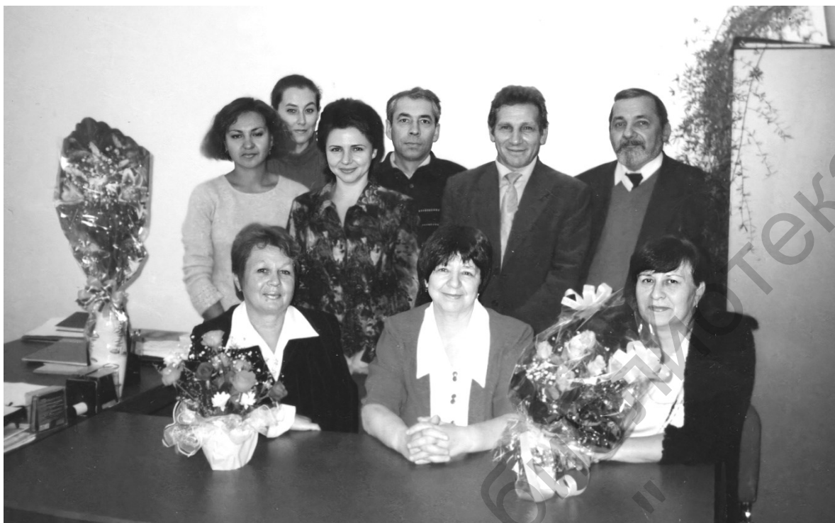
Кафедра ГМИС, 2003 г.