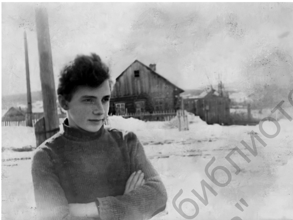
В родной деревне