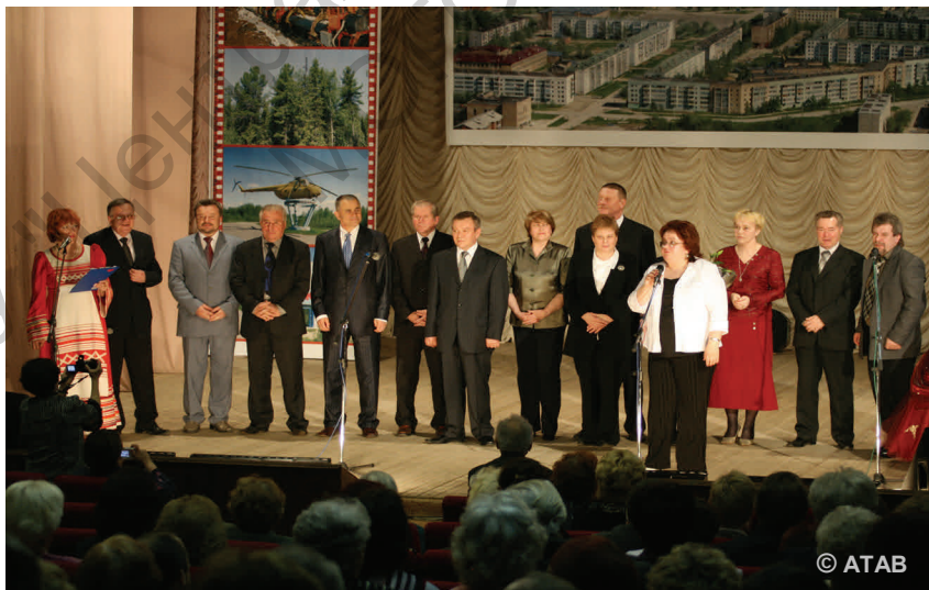
Презентация книги «Вуктыл. Дороги, которые мы выбираем» (г. Вуктыл, май 2007).