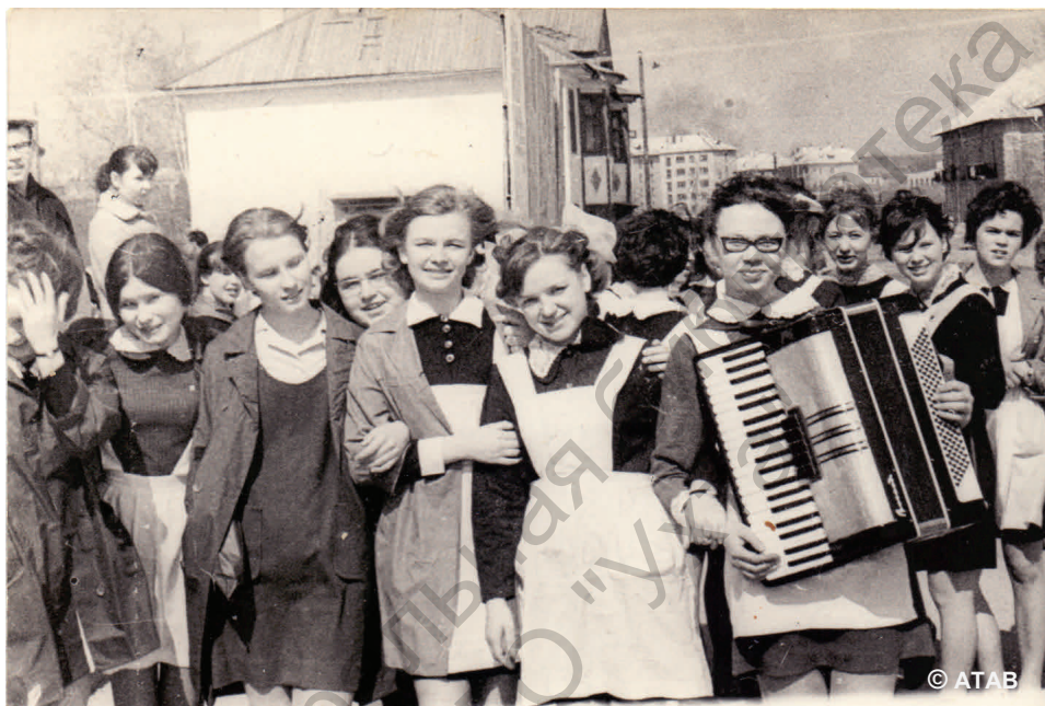
Последний звонок (май 1970)