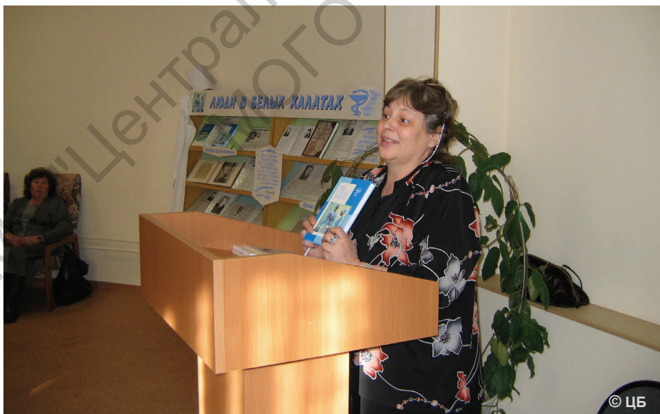
Презентация книги «Люди в белых халатах» (ЦБ, 2009)

В начале 1990-х годов по распоряжению директора филиала ООО