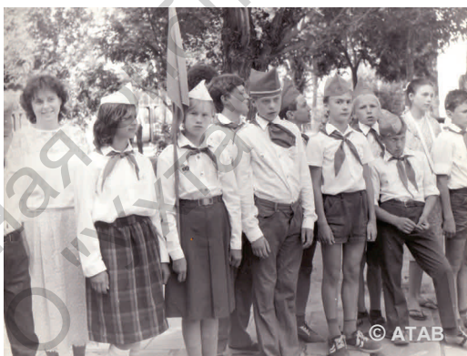
Пионерлагерь «Алые паруса», г. Севастополь (1988)