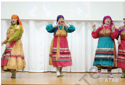
День нефтяной и газовой промышленности в филиале (2012)

Являюсь соавтором книг: по истории ООО «Севергазпром» («ООО «Севергазпром» на рубеже тысячелетий», 2002 г.), подготовке экспозиций выставочных залов ООО «Севергазпром» (ныне Комплекс выставочных залов ООО «Газпром трансгаз Ухта»), книги по истории открытия Вуктыльского НГКМ