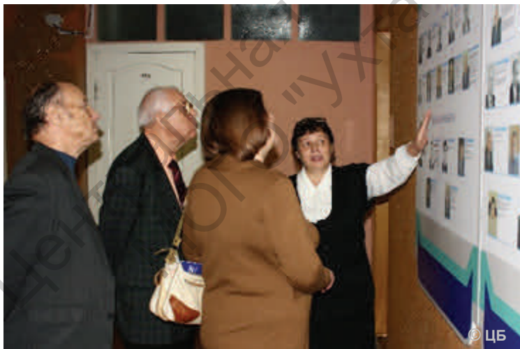
Семинар краеведов в филиале (2010 г.).

В 1990-е годы по приказу ООО «Севергазпром» наш институт был