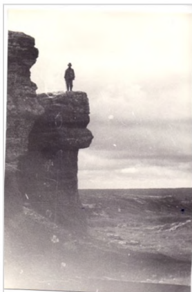
Северный Тиман, руч. Кавказский Арх. В. И. Свиридова