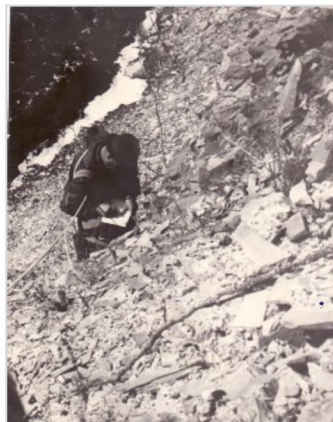
На р. В. Сенка. Обн. 019.