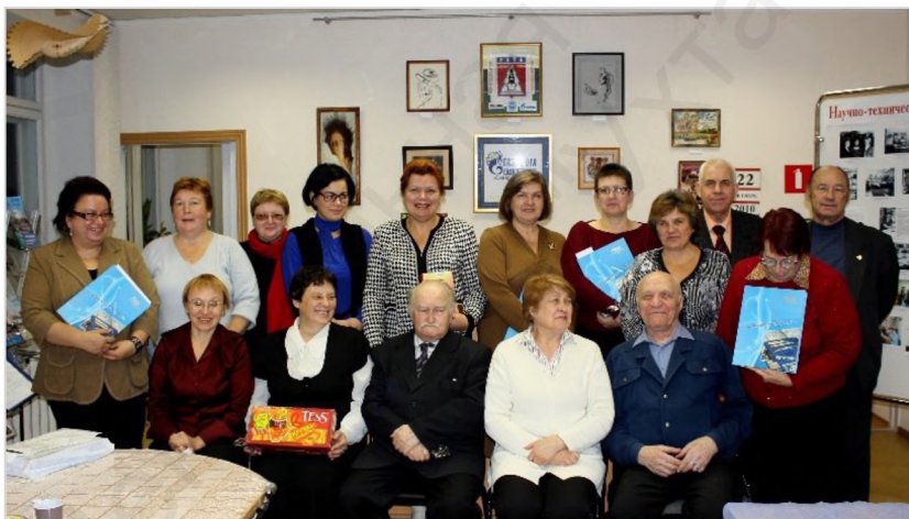
Члены клуба «Краевед» в Ухтинском филиале ООО «Газпром ВНИИГАЗ» (2010).