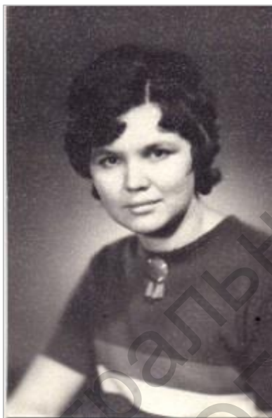
Студентка Коми государственного педагогического института (КГПИ). 1973.