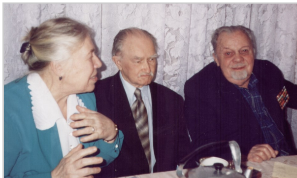
Собрание участников блокады Ленинграда, 2006 г.