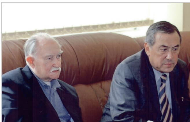
Международная конференция, посвященная юбилею Победы в Великой Отечественной войне. Москва, 2005 г.