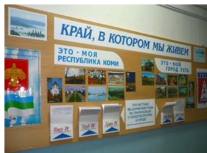
«Край, в котором мы живем».