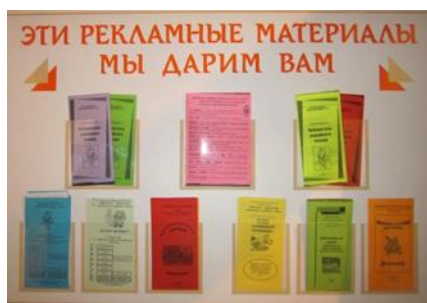
«Эти рекламные материалы мы дарим вам»,